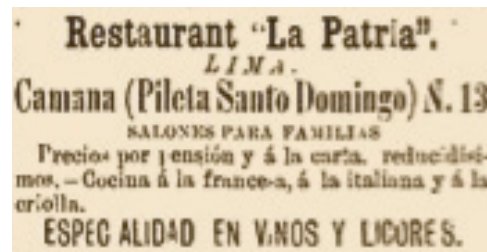
Figura 8. Aviso del restaurante La Patria . El Perú Ilustrado Año 1, Semestre I, Número 13, Página 8 (1887).

Es significativo que la promoción de estándares de belleza y consumo foráneos vaya acompañada, y hasta cierto punto, validada, por una retórica nacionalista, tal como la evidenciada en el anuncio del restaurant “La Patria” (fig. 8), donde la estética afrancesada marca la pauta. A través de enunciados como ese se muestra el tipo de disciplinamiento visual-cultural ejercido por el semanario; un disciplinamiento que pasa por el moldeamiento de los gustos, la rectificación de las prácticas y los deseos. Al promocionar sus platos “ á la francesa, á la italiana y á la criolla, ” (mi énfasis), el aviso concerta una gramática del buen gusto donde el refinamiento sigue una jerarquía que coloca a Francia e Italia como modelos de distinción y a lo “criollo,” para paladares económicamente pudientes pero todavía resistentes, en el último puesto del listado.