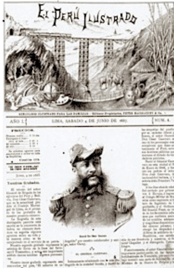
Figura 3. “General Don Cesar Canevaro.” El Perú Ilustrado , Año 1, Semestre I, Número 4, Página 1 (1887).

términos de género. En los primeros años del semanario, este espacio era ocupado por figuras relacionadas con la guerra y los asuntos políticos, lo que se explica por el reciente conflicto bélico con Chile (fig. 3).