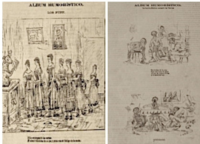
Figura 9. Album Humorístico “Los Puff.” El Perú Ilustrado . Año 3, Semestre II, Número 148, Página 1516 (1890). / Figura 10. Album Humorístico . El Perú Ilustrado Año 3, Semestre II, Número 152, Página 1695 (1890).

contrasta con la visualidad metódica que se crea en todas las secciones anteriores. La relevancia de esta inconsistencia ideológica puede ser leída a partir de los planteamientos de Roland Barthes, según los cuales el sentido no radica en la repetición, sino muy especialmente en la diferencia: “structurally, meaning is not born by repetition but by difference, so that a rare term, as soon as it is caught in a system of exclusions and relations, means just as much as a frequent term ” (33; mi énfasis). Lejos de afirmar la creación consciente y deliberada de esa fisura ideológica, mi lectura es que el disciplinamiento constante que se ejerce en la visualidad de las imágenes se relaja en esta última que es vista como la parte no integrada al proyecto de industrialización y modernización del que forma parte el resto de la publicación.