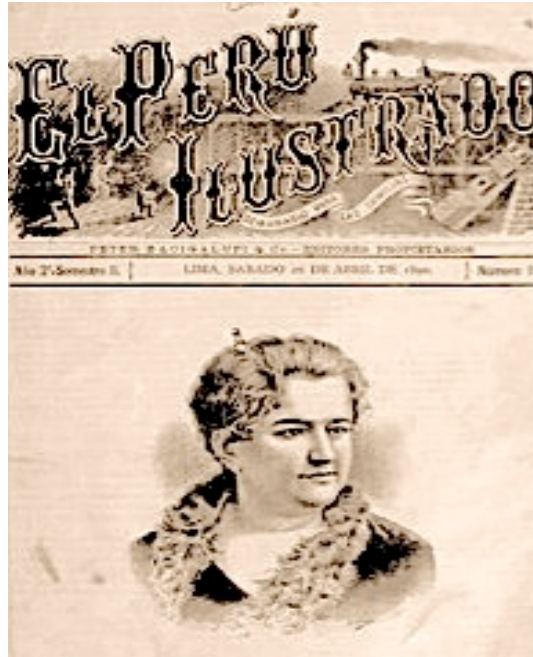
Figura 4. Emilia Pardo Bazán. El Perú Ilustrado Año 3, Semestre II, Número 155, Página 1765 (1890).

En la distribución sistemática de las imágenes, las páginas siguientes presentaban grabados relacionados con emblemas de la industrialización o cultura dentro del territorio nacional. La geografía accidentada y la falta de comunicación hacía que estas insignias de la civilización se concentraran por lo general en espacios urbanos, o en su defecto, lugares del interior emblemáticos por la ubicación/producción de una materia prima exportable. A la narrativa visual de una nación con producción industrial propia (fig. 5), aun cuando se tratara de industrias de capitales extranjeros, se añade la visión de un Perú de producción industrial-comercial sofisticada, a través de ilustraciones como la de una fábrica nacional de pianos y otros establecimientos comerciales prestigiosos (fig. 6).