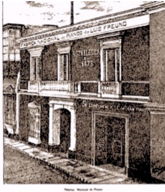
Figura 6. “Fábrica Nacional de Pianos de Luis Freund.” El Perú Ilustrado . Año 1, Semestre I, Número 9, Página 4 (1887).

Algunos aspectos problemáticos saltan a la vista en esa visualidad que enaltece los avances de la industrialización y el refinamiento de los gustos burgueses. Por ejemplo, los elementos emblemáticos de una producción/consumo refinados no solo hacen referencia a bienes suntuarios, no necesariamente producidos a una escala tan grande como para garantizar una industria nacional sólida y sostenible, sino que también evidencian la necesidad de establecer las fábricas en edificaciones virreinales (figs. 5 y 6) dada la falta de recursos económicos. 15