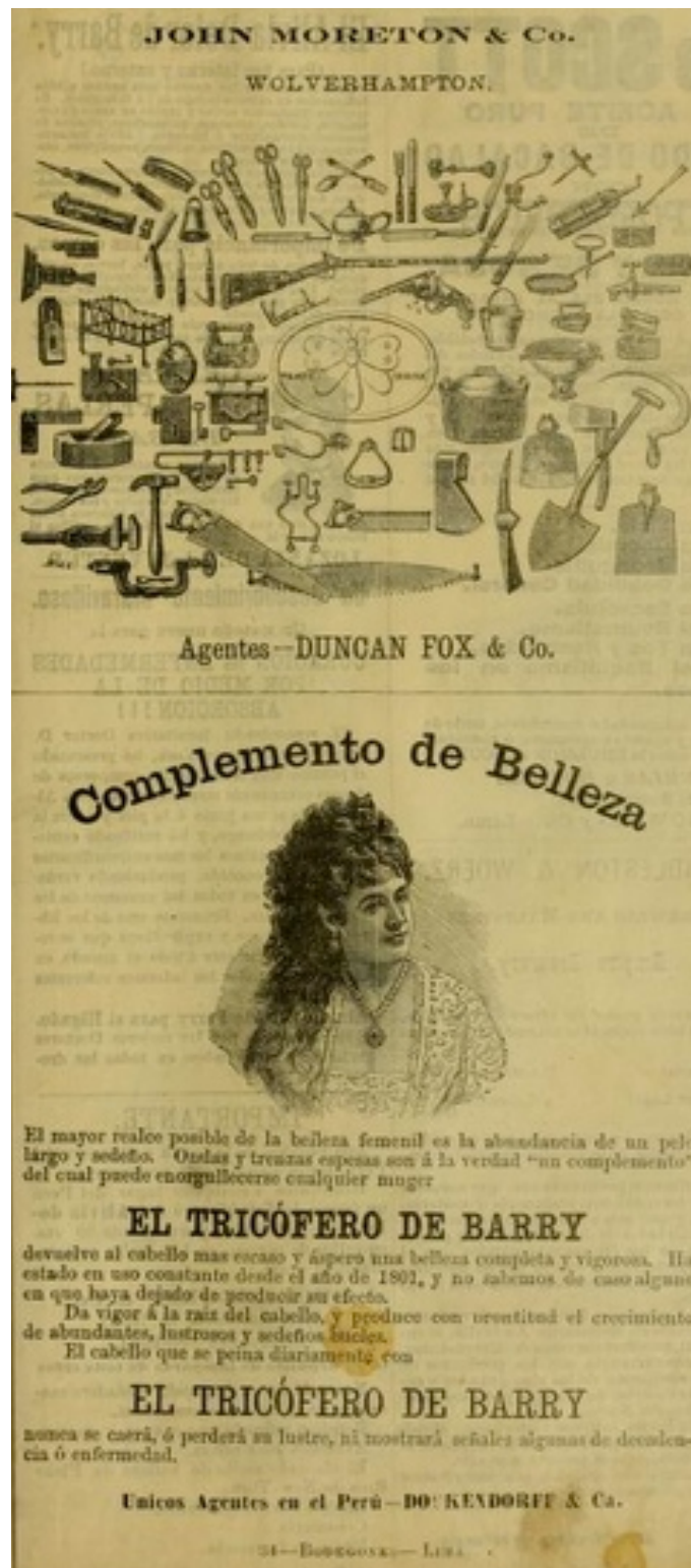
Figura 7. Arriba: publicidad de herramientas de ferretería John Moreton & Co. Abajo: publicidad de producto de belleza Tricófero de Barry. El Perú Ilustrado. Año 3, Semestre II, Número 154, Página 1752 (1890).