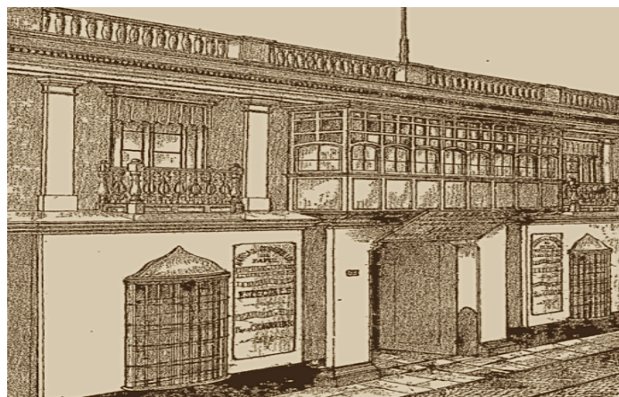
Figura 5. Fábrica de Cigarrillos “La Habana.” El Perú Ilustrado . Año 1, Semestre I, Número 7, Página 4 (1887).

En la distribución sistemática de las imágenes, las páginas siguientes presentaban grabados relacionados con emblemas de la industrialización o cultura dentro del territorio nacional. La geografía accidentada y la falta de comunicación hacía que estas insignias de la civilización se concentraran por lo general en espacios urbanos, o en su defecto, lugares del interior emblemáticos por la ubicación/producción de una materia prima exportable. A la narrativa visual de una nación con producción industrial propia (fig. 5), aun cuando se tratara de industrias de capitales extranjeros, se añade la visión de un Perú de producción industrial-comercial sofisticada, a través de ilustraciones como la de una fábrica nacional de pianos y otros establecimientos comerciales prestigiosos (fig. 6).