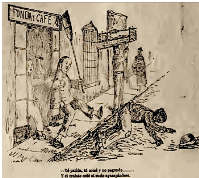
Figura 11. El Perú Ilustrado . Año 3, Semestre II, Número 141, Página 1304 (1890).

De igual modo, la representación de mulatos—sujetos no blancos—en la figura 10 muestra las tensiones que, desde lo visual, problematizan el proyecto nacional propuesto por el semanario. La representación caricaturizada y en clave grotesca de los mulatos evidencia la problemática mirada racista de la publicación. Mientras las páginas anteriores se esforzaban en invisibilizar los sectores no blancos de la población, más allá de las imágenes de cuestionable tono costumbrista, ese Perú racializado y subalternizado aflora en las secciones finales, en esa sección miscelánea donde convive con la nota humorística y donde la única óptica posible es el espejo deformador de la caricatura.